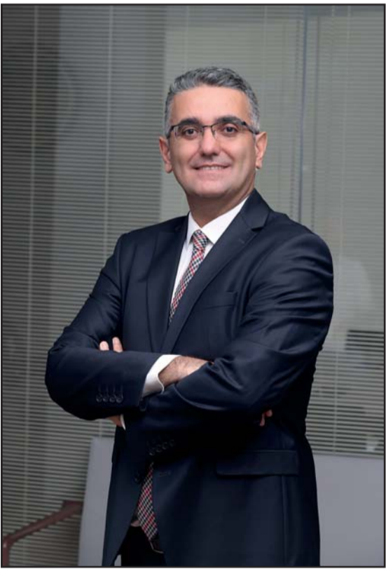
ve bu başarının en büyük paydaşları olan reklam, medya planlama ve halkla ilişkiler

üste üçüncü kez kazanıyoruz. Bu istikrarlı başarı için tüm çalışma arkadaşlarımı kutluyorum. 2024 yılında da yine yolcu memnuniyeti odaklı bir yaklaşımla yol arkadaşlarımıza Kâmil Koç'un hizmet kalitesini yaşatmaya devam edeceğiz."